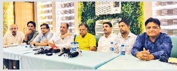
नारनौल। क्लब की उपलब्धियों के साथ भविष्य की प्लानिंग बताते रोटरीयन।

मोक्ष वाहन: रोटरी क्लब ने शहर के बड़ते दरबरे को देखते हुए क्षेत्र में अंतिम यात्रा के लिए मोक्ष वाहन की सुविधा का शुभारंभ करीब पांच वर्ष पूर्व किया था। जो कि आज क्षेत्र की जरूरत बन चुका है और आज क्लब द्वारा दो मोक्ष वाहनों का संचालन किया जा रहा है। इसके अलावा रवाडी रोड स्थित स्वर्ण आश्रम के सौंदर्योत्थरण का कार्य, भगवान मोलेनाथ की प्रतिमा स्थापना, हॉल का निर्माण, वाटर कूलर, अस्थियां रखने के लिए लॉकर सुविधा, मोर्करी रिक्रिजेटर इत्यादि कार्य भी स्वर्ण आश्रम में चलाए जा रहे हैं।