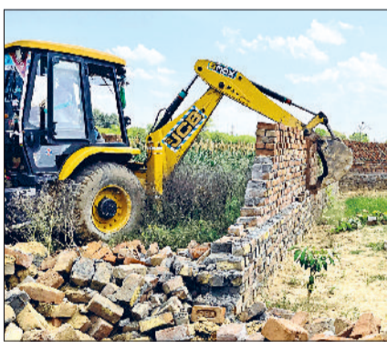
नारनौल। अवैध निर्माण हटती जेसीबी।

जिला नगर योजनाकार की टीम की ओर से शहरी क्षेत्र नारनौल के मंडलाना रोड पर करीब 2.5 एकड़ भूमि में विकसित की जा रही अवैध कालोनी में तोड़फोड़ की कार्यवाही की गई। राजस्व सम्पदा में कुछ लोगों द्वारा करीब 2.5 एकड़ भूमि में नगर व ग्राम योजना विभाग हरियाणा के महानिदेशक की बिना लाइसेंस अनुमति लिए अवैध कालोनी बनाई जा रही थी। इसके अलावा रोड नेटवर्क बिछाए जा रहे थे जिसे जिला प्रशासन की मदद से तोड़ दिया गया। इस कार्यवाही में दो चारदीवारी व तीन डीपीसी के साथ-साथ सभी कच्चे रास्ते उखाड़ दिए गए। यह कार्यवाही जिला नगर योजनाकार की अगुवाई में स्टाफ सदस्यों के साथ भारी पुलिस बल की मौजूदगी में अमल में लाई गई। जिला नगर योजनाकार मंदीन सिंह सिहाग ने लोगों से कहा है कि नियंत्रित क्षेत्र, शहरी क्षेत्र में कोई भी निर्माण बिना विभागीय अनुमति के ना करे तथा नगर व ग्राम योजना विभाग हरियाणा के महानिदेशक से लाइसेंस अनुमति लेने उपरान्त ही कृषि भूमि को रिहायशी व