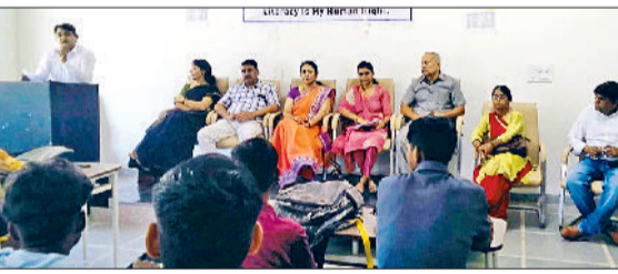
नारनौल। कार्यक्रम को संबोधित करते वक्ता।

साल पहले हुआ था, जिसकी रिपेयर नहीं होने के कारण स्थिति दयनीय नहीं हुई है। उन्होंने उन्होंने दंत ओपीडी के साथ आईपीडी सुविधा देना सुनिश्चित करने का निर्देश दिया था। अधिभेक सिंचानिया से चिकित्सा संबंधी समस्याएं जानी। ओपीडी में मरीजों के लिए बैठने व स्वच्छ पेयजल का प्रबंध करने के निर्देश दिए हैं। आपातकालीन वार्ड की सफाई का जायजा लिया। मरीजों के लिए अल्ट्रासाउंड के लिए पीड़ितों को नारनौल भेजना उचित नहीं। क्योंकि वहां भीड़ रहने की वजह से समय की बर्बादी और अव्यवस्था का सामना करना पड़ता है।