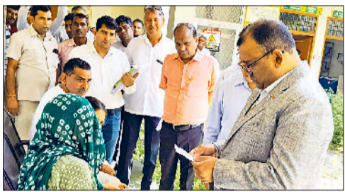
नारनौल। निरीक्षण करते राष्ट्रीय मानव अधिकार आयोग के स्पेशल मॉनिटर बालकृष्ण गोयल व निरीक्षण करते राष्ट्रीय मानव अधिकार आयोग के स्पेशल मॉनिटर।