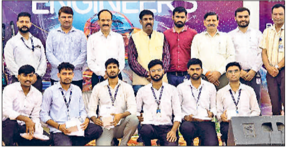
महेंद्रगढ़। विद्यार्थियों को सम्मानित करता कॉलेज स्टाफ।