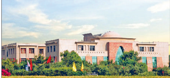
नारनौल। सिंधानिया विश्वविद्यालय।

नारनौल। दिल्ली उच्च न्यायालय ने यूजीसी के उस आदेश को निरस्त कर दिया है, जिसमें सिंधानिया विश्वविद्यालय पंचेरी बड़ी झुंझुनू को पीएचडी प्रवेश से वंचित किया गया था। अदालत ने स्पष्ट कहा कि यूजीसी के पास ऐसा प्रतिबंध लगाने का कोई अधिकार नहीं था। अब विश्वविद्यालय के पीएचडी कार्यक्रम तुरंत प्रभाव से शुरू हो गए हैं। विश्वविद्यालय प्रशासन ने कहा कि यह फैसला हमारी पारदर्शी और छात्र केंद्रित शैक्षणिक नीति की पुष्टि करता है। हम सभी नियमों व विनियमों का बहुत कड़ाई से पालन कर रहे हैं और आगे भी करते रहेंगे। शोखावटी क्षेत्र में ज्ञान व शोध का मार्ग प्रशस्त करने में विश्वविद्यालय पहले की तरह आगे भी अग्रणी भूमिका निभाता रहेगा।