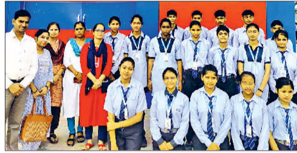
नारनौल। प्रतियोगिता के विजेता प्रतिभागी।

दाखिल भी किया जा रहे हैं। वहीं दवाइयों स्टॉक भी चेक किया। इस मौके पर जिला समाज