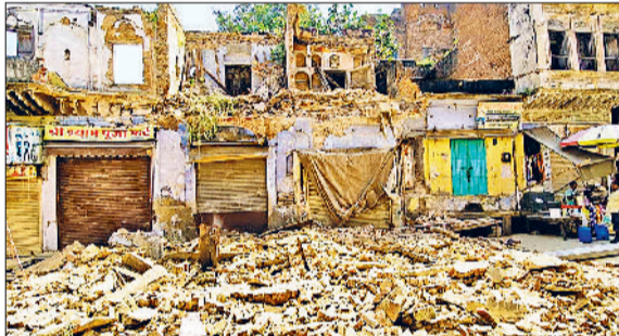
नारनौल। आजाद चौक मार्ग पर गिरी पुरानी हवेली।

आजाद चौक के समीप बीच बाजार बीती रात्रि करीब दो बजे दुकानों के ऊपर स्थित एक खंडहर हवेली अचानक भरभराकर गिर गई। हालांकि रात्रि के समय इसके गिरने पर कोई हताहत तो नहीं हुआ, लेकिन इससे इसके नीचे एवं आसपास की बनी दुकानों को कुछ नुकसान जरूर हो गया। बिजली का एक खंभा टूटकर सड़क के आरपाय गिरने से आसपास के एरिया की बिजली आपूर्ति बाधित हो गई। हवेली का मलबा सड़क पर बिखर गया, जो सवरे तक पड़ा रहने से आवागमन बाधित रहा। इससे आसपास के लोगों, खासकर दुकानदारों में दहशत फैल गई। मानक चौक से आजाद चौक मार्ग को शहर के मुख्य बाजार का केंद्र माना जाता है तथा यहाँ दिनभर भारी चहल-पहल बनी रहती है। बीती रात को इसी मार्ग पर पुरानी हवेली की ऊपर की दो मंजिलें अचानक भरभराकर गिर गईं।