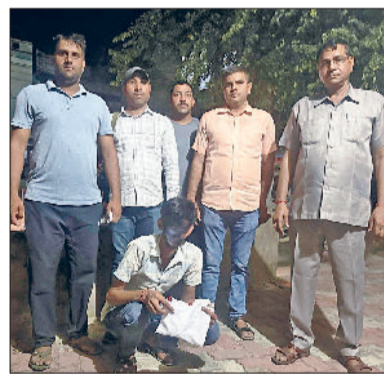
महेंद्रगढ़। टीम की गिरफ्तार में आरोपित।