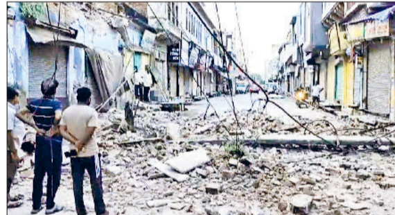
नारनौल। सड़क के बीचोबीच पड़ा मलबा एवं टूटा पोल।