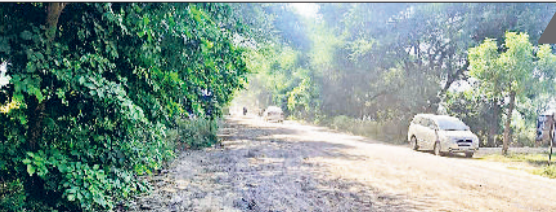
कनीना। टूटी सड़क के कारण सड़क में बने गड्ढे।

हाल ही में हुई भारी बरसात ने जिले की सड़कों की स्थिति को बुरी तरह प्रभावित कर दिया है। महेंद्रगढ़-कनीना-कोसली स्टेट हाईवे-24 के साथ-साथ कई ग्रामीण लिंक मार्ग जगह-जगह से टूट गए हैं। सड़क पर बने गहरे गड्ढे अब वाहन चालकों और आमजन के लिए बड़ी परेशानी का कारण बन रहे हैं। इससे सड़क हादसों की आशंका लगातार बढ़ती जा रही है। बता दें कि गत दिनों में जिले में काफी दिन लगातार बारिश हुई थी। कनीना-महेंद्रगढ़ सड़क मार्ग