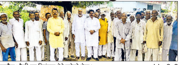
नारनौल। रैली का निमंत्रण देते इनेलो नेता।