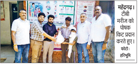
महेंद्रगढ़। टीबी मरीजों को पोषक किट प्रदान करते हुए।

टीबी यानी क्षय रोग को लेकर कुछ लोगों में कुछ गलत धारणा बनी हुई है कि यह बीमारी लाइलाज है और इसका कोई इलाज नहीं है, जबकि ऐसा नहीं है। सही समय उपचार लेने पर इस बीमारी को जड़ से खत्म किया जा सकता है। अगर किसी मनुष्य को यह बीमारी हो जाती है, तो इसका नागरिक अस्पतालों में छह महीने तक रेगुलर इलाज करवाने पर इस बीमारी से पूर्णतया रूप से निजात पाया जा सकता है। यदि टीबी के लक्षणों की पहचान कर सही समय पर उचित उपचार हो तो यह बीमारी आसानी से ठीक हो सकती है। आज टीबी