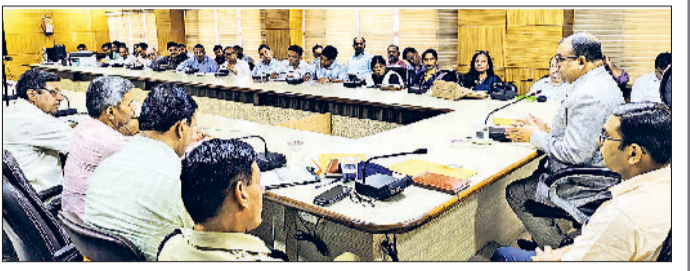
नारनौल। निरीक्षण करते राष्ट्रीय मानव अधिकार आयोग के स्पेशल मॉनिटर बालकृष्ण गोयल व निरीक्षण करते राष्ट्रीय मानव अधिकार आयोग के स्पेशल मॉनिटर।